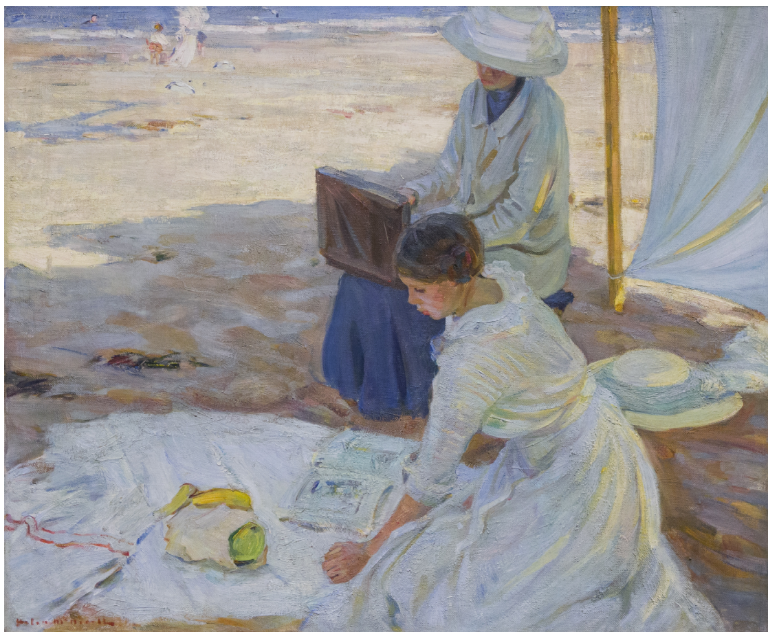
Helen McNicoll, À l'ombre de la tente, 1914 Huile sur toile, 83,5 x 101,2 cm. Montréal, Musée des beaux-arts de Montréal.